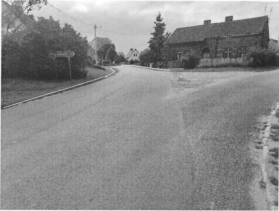
Zdjęcie nr 5.