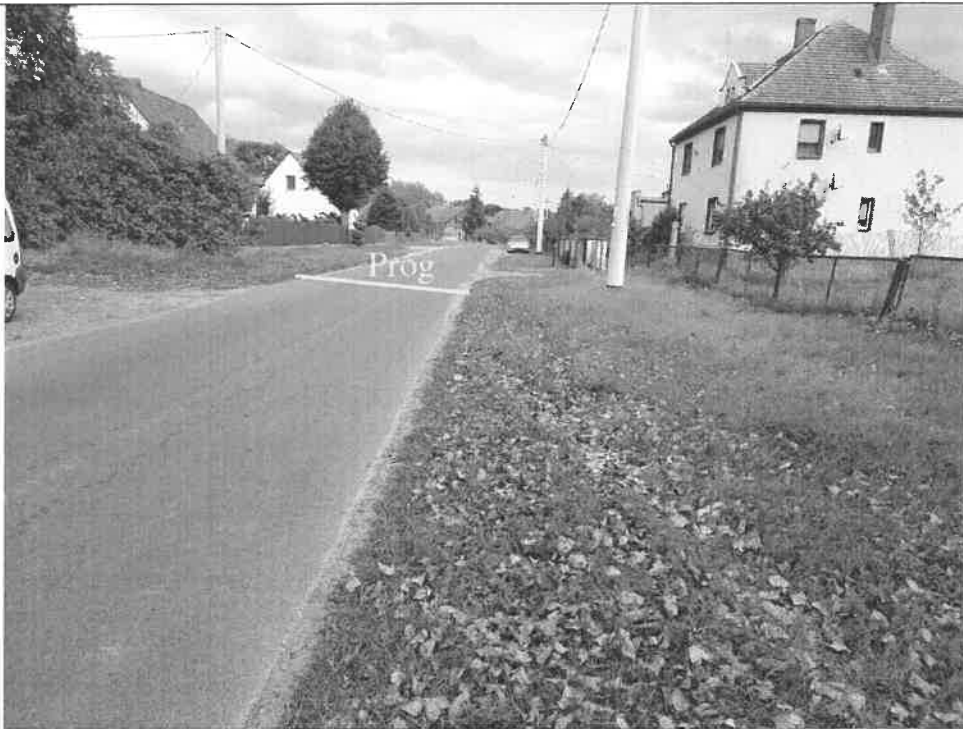
Zdjęcie nr 3. Widok drogi dojazdowej od strony Pałcka.