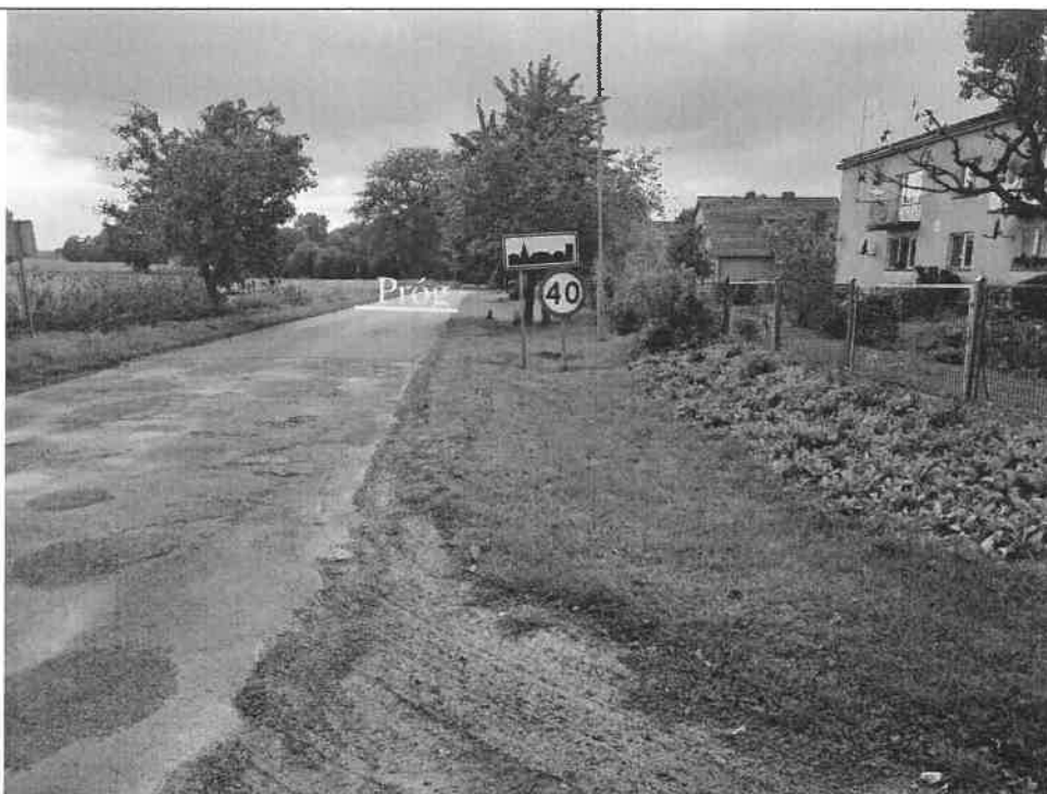
Zdjęcie 1. Widok drogi dojazdowej wraz z zabudowaniami Niekarzyna od strony Kępska.