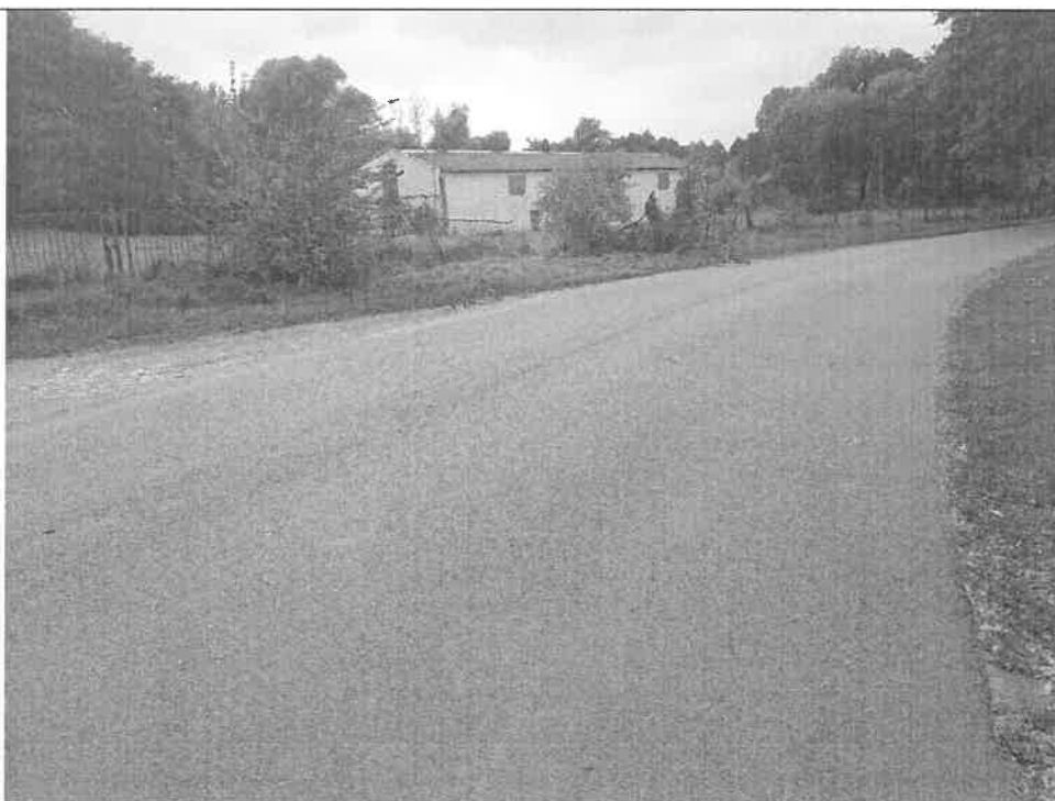
Zdjęcie nr 2. Widok uszkodzonego ogrodzenia.