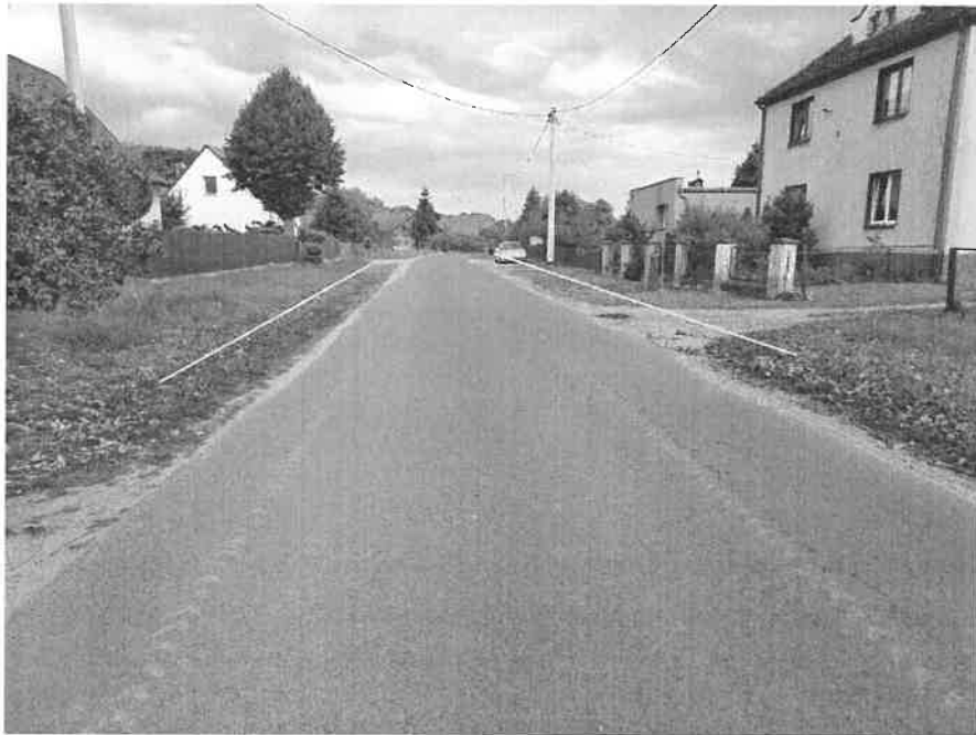
Zdjęcie nr 6.