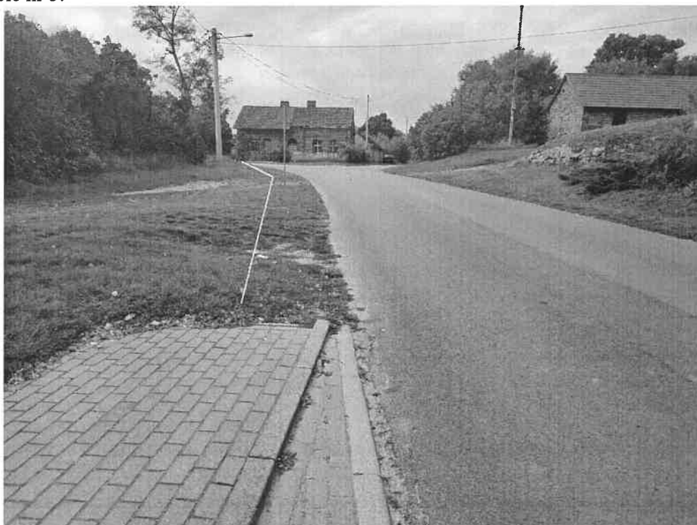
Zdjęcie nr 4. Widok pobocza od zatoczki autobusowej w kierunku drogi do miejscowości. Pałk(zdjęcia 4 do 6).